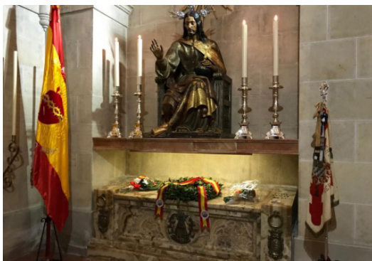
Capilla en la que se veneran los restos del Mártir de Cristo Rey