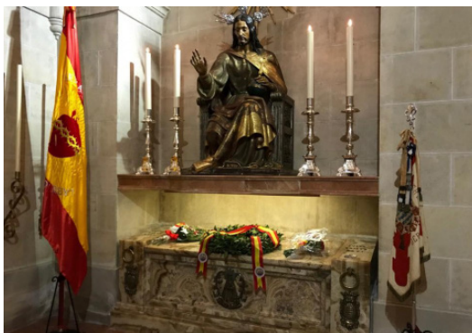
Capilla en la que se veneran los restos del Mártir de Cristo Rey